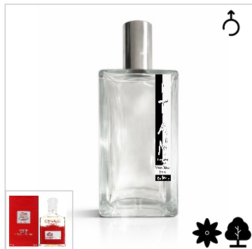
Inspirado en Creed Viking