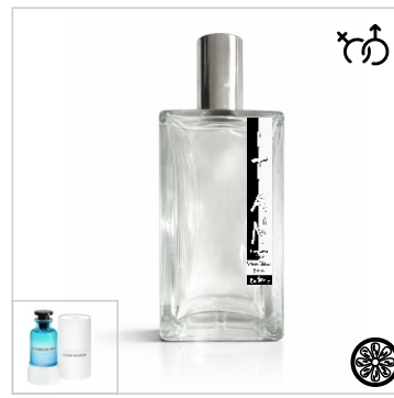
Inspirado en Louis Vuitton Afternoon Swim