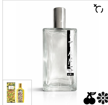
Inspirado en Gucci Flora Gorgeous Orchid