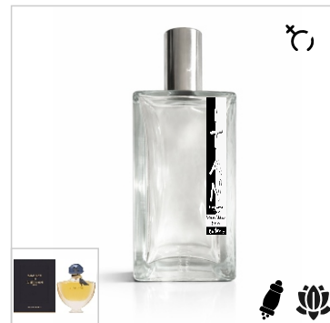
Inspirado en Guerlain Shalimar