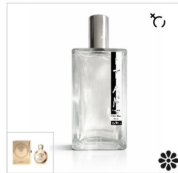
Inspirado en Versace Eros