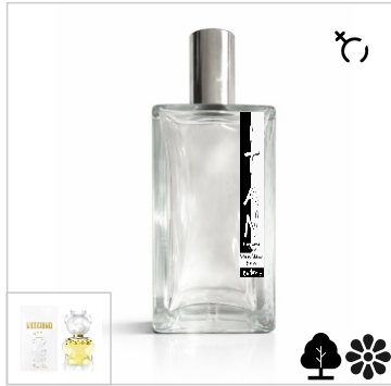
Inspirado en Moschino Toy 2