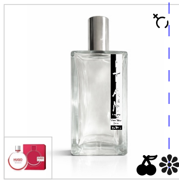
Inspirado en Hugo Boss Hugo Woman