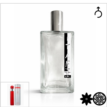
Inspirado en Perry Ellis 360