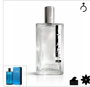
Inspirado en Davidoff Cool Water