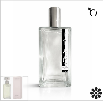
Inspirado en Calvin Klein Eternity