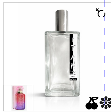
Inspirado en Kayali Rose Royale 31