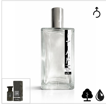
Inspirado en Tom Ford Oud Wood