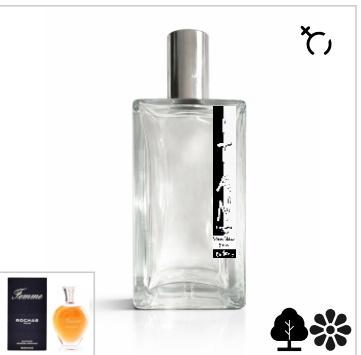
Inspirado en Femme Rochas