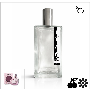
Inspirado en Bebe Sheer