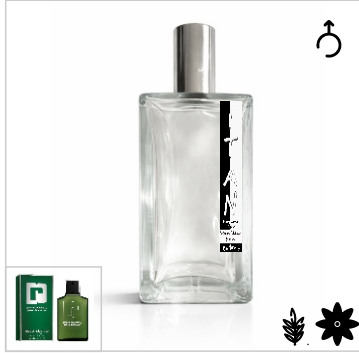
Inspirado en Paco Rabanne Pour Homme