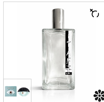
Inspirado en Kenzo World