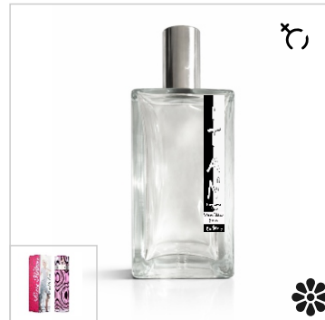
Inspirado en Paris Hilton