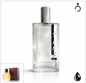
Inspirado en Paloma Picasso Minotaure