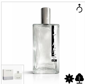
Inspirado en Lacoste Essential