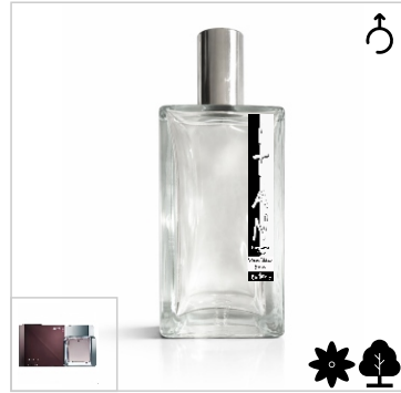
Inspirado en Calvin Klein Euphoria