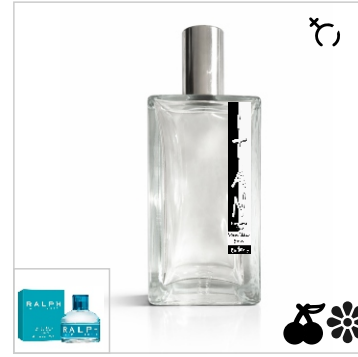
Inspirado en Ralph Lauren Ralph