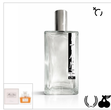
Inspirado en Christian Dior Miss Dior Cherie