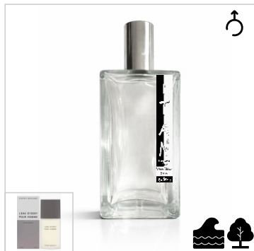
Inspirado en Issey Miyake