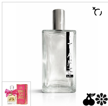
Inspirado en Juicy Couture Viva la juicy