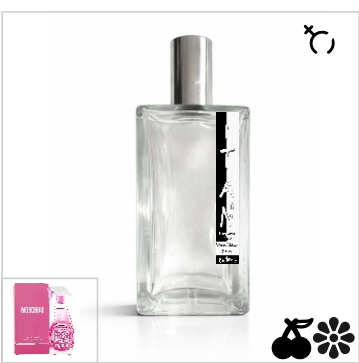
Inspirado en Moschino Pink Fresh Couture