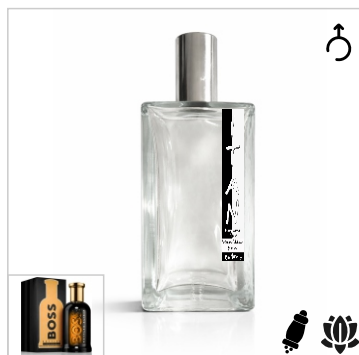
Inspirado en Hugo Boss Bottled Elixir