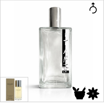
Inspirado en Calvin Klein Escape