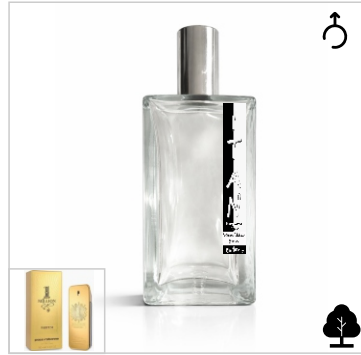
Inspirado en Paco Rabanne One Million