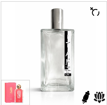
Inspirado en Afnan 9am Pour Femme