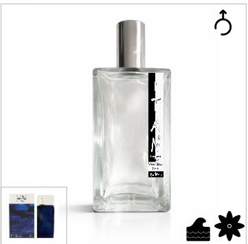
Inspirado en Kenzo Leau Par Intense