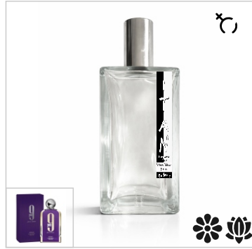
Inspirado en Afnan 9pm