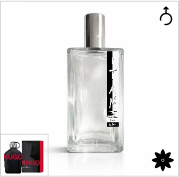
Inspirado en Hugo Boss Just Different