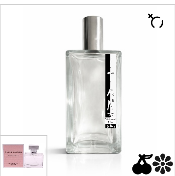
Inspirado en Ralph Lauren Romance