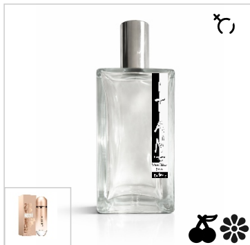
Inspirado en Carolina Herrera 212 Rose VIP