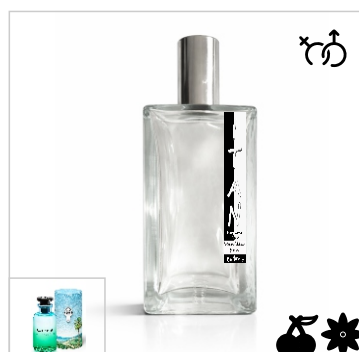
Inspirado en Louis Vuitton Pacific Chill