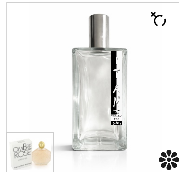
Inspirado en Jean Charles Brosseau Ombre Rose