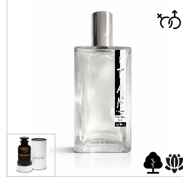
Inspirado en Louis Vuitton Ombre Nomade