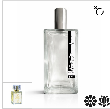
Inspirado en SG