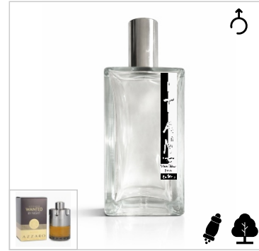
Inspirado en Azzaro Wanted by Night