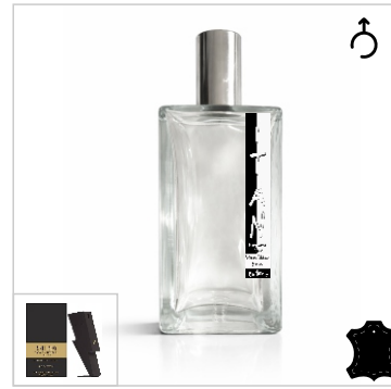
Inspirado en Carolina Herrera Bad Boy Le Parfum