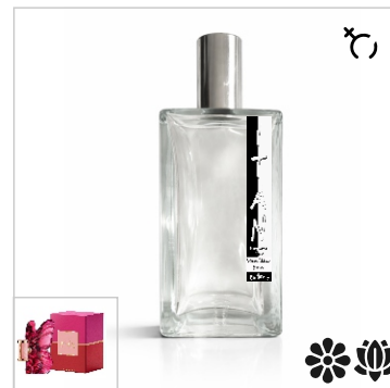
Inspirado en Carolina Herrera La Bomba