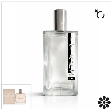
Inspirado en Givenchy Irresistible