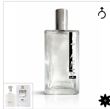
Inspirado en Creed Silver Mountain