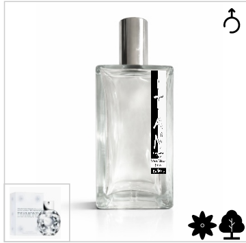
Inspirado en Emporio Armani Diamonds