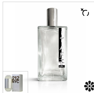
Inspirado en Carolina Herrera 212