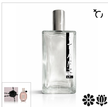
Inspirado en Viktor & Rolf Flowerbomb