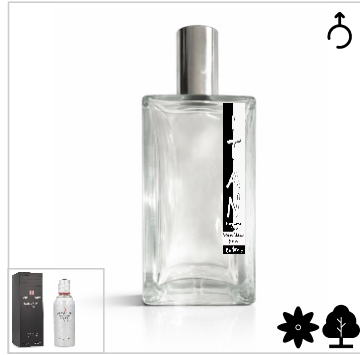
Inspirado en Victorinox Swiss Army Classic