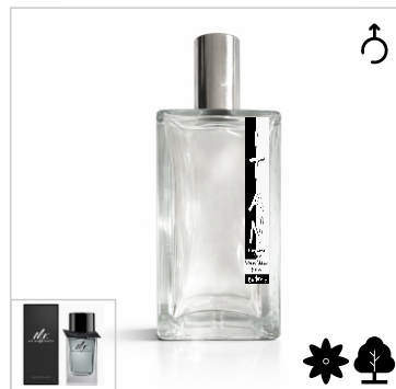
Inspirado en Mr. Burberry