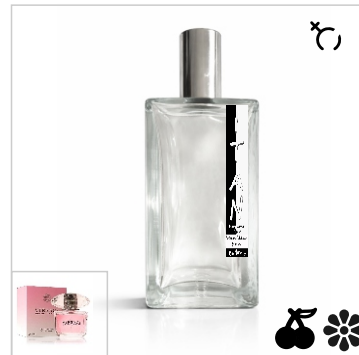
Inspirado en Versace Bright Crystal