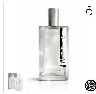
Inspirado en Calvin Klein Ck All