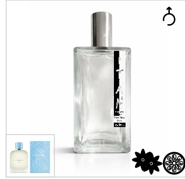
Inspirado en Dolce & Gabbana Light Blue