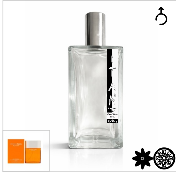
Inspirado en Clinique Happy