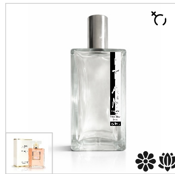
Inspirado en Chanel Coco Mademoiselle