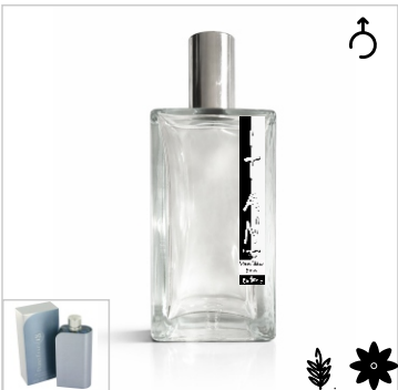
Inspirado en Perry Ellis 18