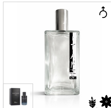
Inspirado en Christian Dior Sauvage