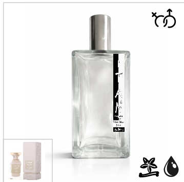
Inspirado en Tom Ford Vanilla Sex