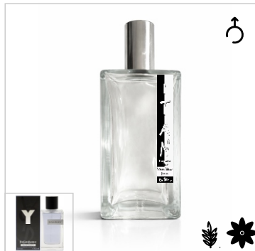
Inspirado en Yves Saint Laurent Y