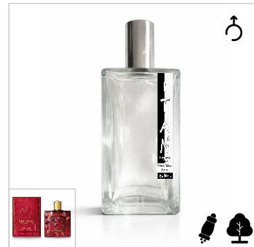
Inspirado en Versace Eros Flame