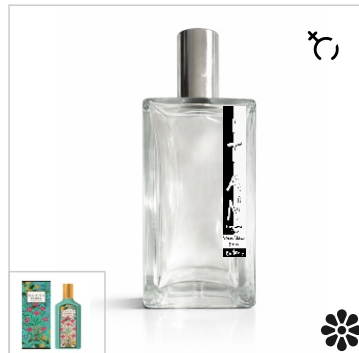
Inspirado en Gucci Flora Gorgeous Jasmine