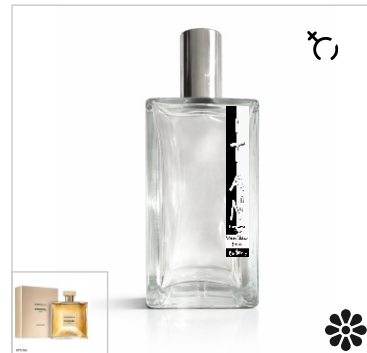
Inspirado en Chanel Gabrielle