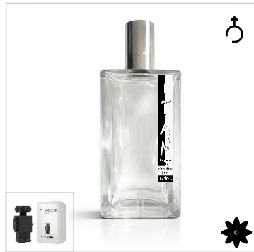
Inspirado en Paco Rabanne Phantom