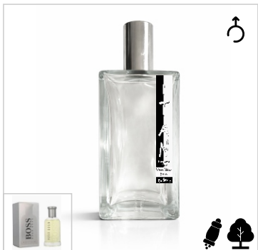
Inspirado en Hugo Boss Bottled