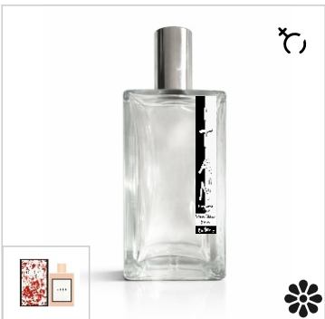
Inspirado en Gucci Bloom