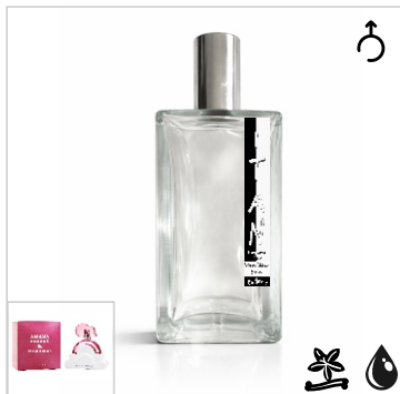
Inspirado en Ariana Grande Cloud Pink