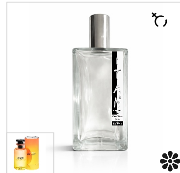
Inspirado en Louis Vuitton Sun Song