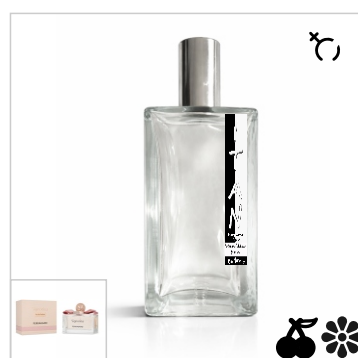
Inspirado en Salvatore Ferragamo Signorina