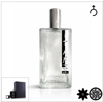
Inspirado en Guerlain Lui