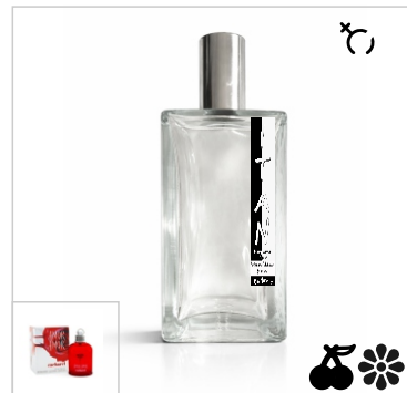
Inspirado en Cacharel Amor Amor