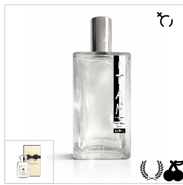
Inspirado en Jo Malone English Pear & Freesia