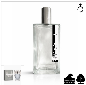
Inspirado en Paco Rabanne Invictus