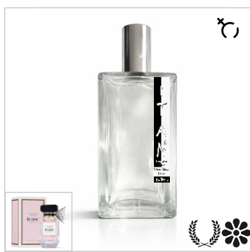
Inspirado en Tease