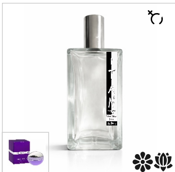
Inspirado en Paco Rabanne Ultraviolet