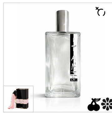
Inspirado en Carolina Herrera Good Girl