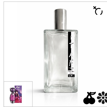
Inspirado en Katy Perry Purr