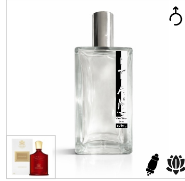
Inspirado en Creed Centaurus