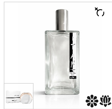
Inspirado en Mont Blanc Presence