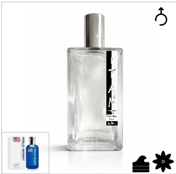
Inspirado en Ralph Lauren Polo Sport