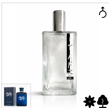
Inspirado en Ralph Lauren Polo 67