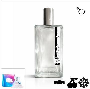
Inspirado en Ariana Grande Cloud