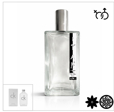
Inspirado en Calvin Klein CK One