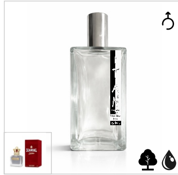
Inspirado en Jean Paul Gaultier Scandal