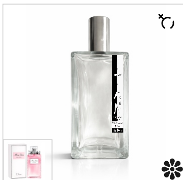
Inspirado en Christian Dior Miss Dior Rose N'roses