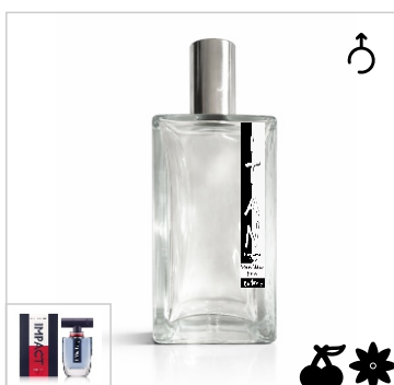
Inspirado en Tommy Hilfiger Impact