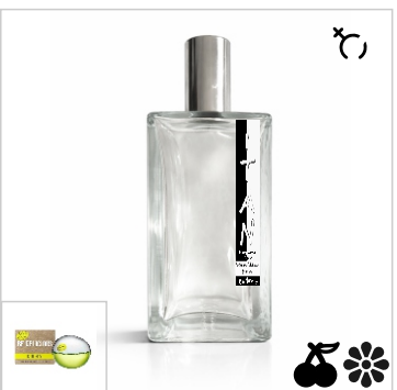
Inspirado en Donna Karan Be Delicious