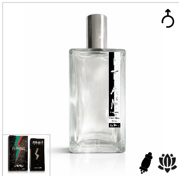
Inspirado en Animale