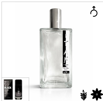
Inspirado en Carolina Herrera 212 Vip Black