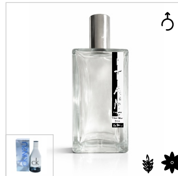
Inspirado en Calvin Klein CKIN2U