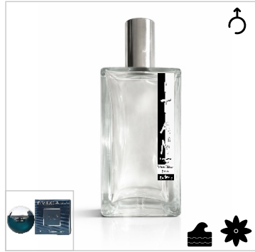
Inspirado en Bvlgari Aqua