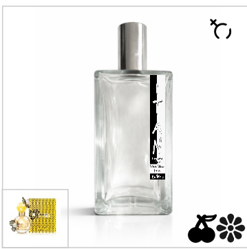
Inspirado en Marc Jacobs Honey