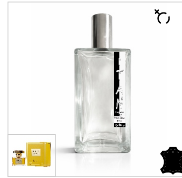
Inspirado en Jean Patou Sublime