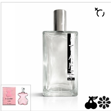
Inspirado en Tous Love Me