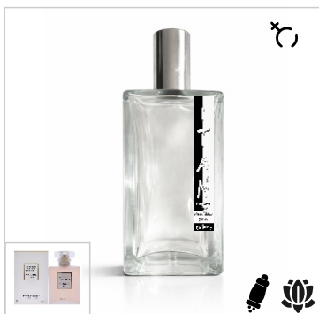
Inspirado en Chanel Coco