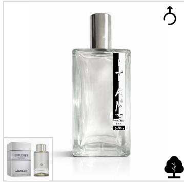
Inspirado en Montblanc Explorer Platinum