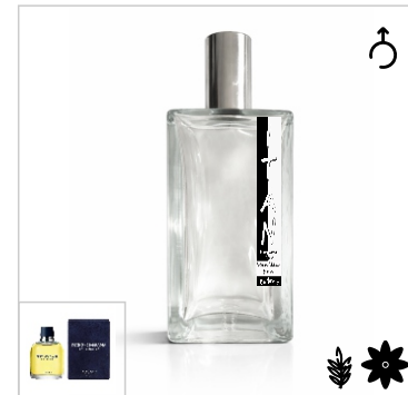
Inspirado en Dolce & Gabbana