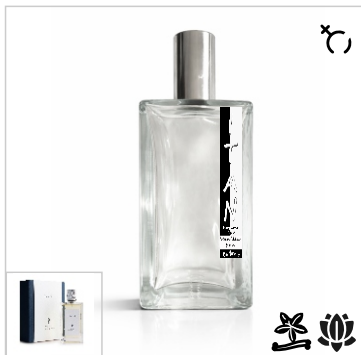
Inspirado en Profumi Di Polignano Solo Lei