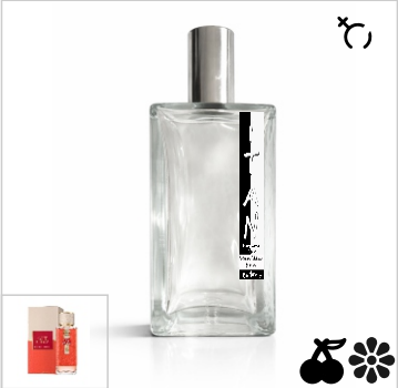
Inspirado en Carolina Herrera Cute Chaos