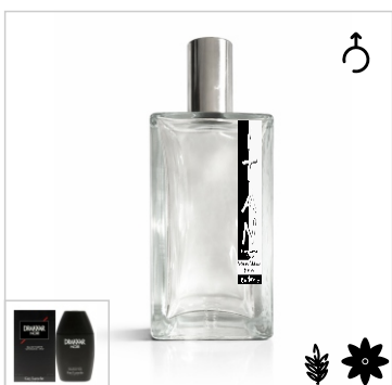
Inspirado en Guy Laroche Drakkar Noir