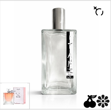
Inspirado en Lancôme La Vie Est Belle