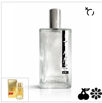
Inspirado en Hugo Boss Hugo XX