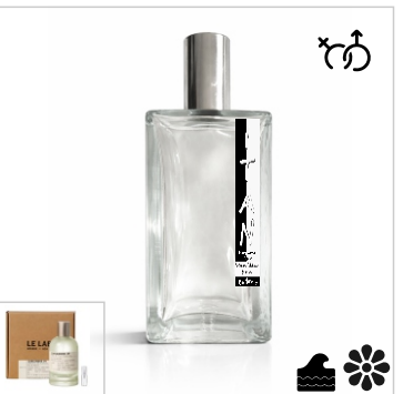
Inspirado en Le Labo Coriandre 39