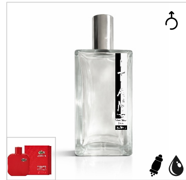
Inspirado en Lacoste L.12.12 Rouge