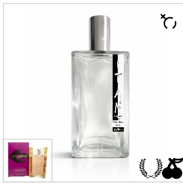
Inspirado en Emanuel Ungaro Ungaro