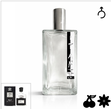
Inspirado en Creed Aventus