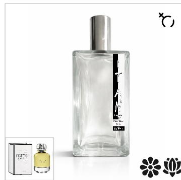
Inspirado en Givenchy L'Interdit