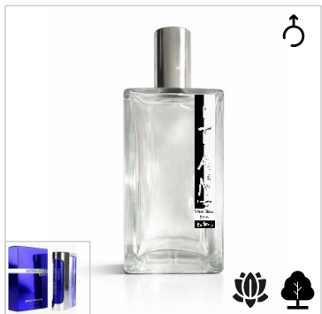
Inspirado en Paco Rabanne Ultraviolet