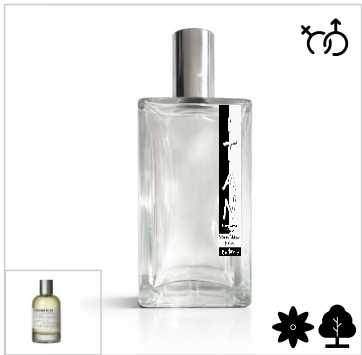
Inspirado en Le Labo Bergamote 22