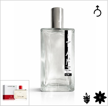
Inspirado en Lacoste Red