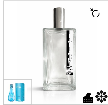
Inspirado en Davidoff Cool Water