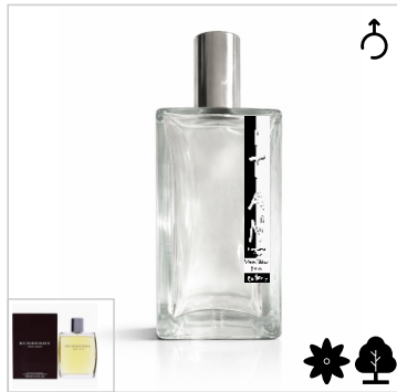
Inspirado en Burberry for Men