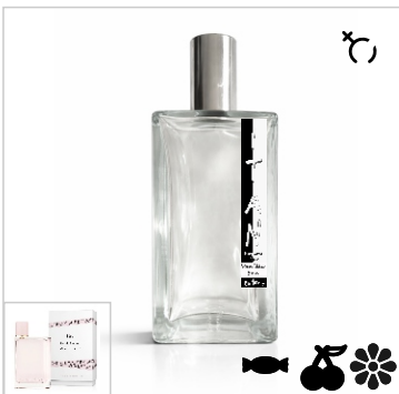
Inspirado en Burberry Her