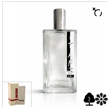
Inspirado en Burberry Sport