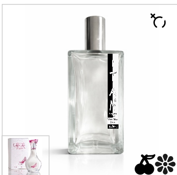
Inspirado en Paris Hilton Can Can