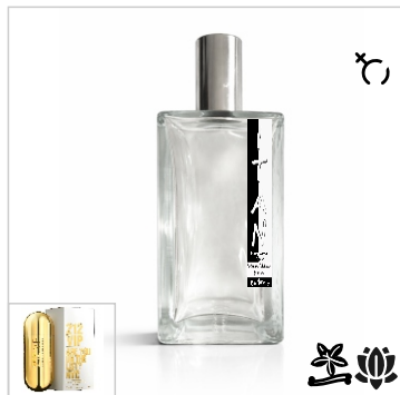
Inspirado en Carolina Herrera 212 VIP