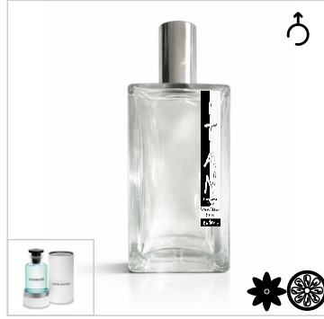
Inspirado en Louis Vuitton Imagination