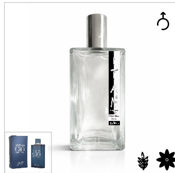
Inspirado en Giorgio Armani Acqua Di Gio Profumo