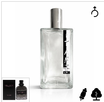
Inspirado en Valentino Uomo Born In Roma