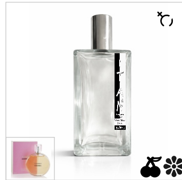
Inspirado en Chanel Chance