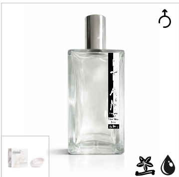
Inspirado en Ariana Grande Mod Vanilla