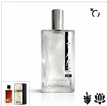
Inspirado en Yves Saint Laurent Libre