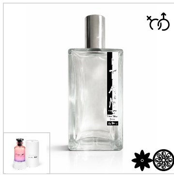
Inspirado en Louis Vuitton City Of Stars