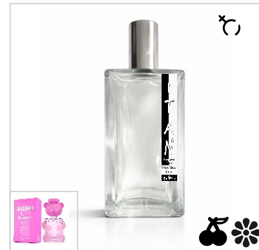
Inspirado en Moschino Toy 2 Bubble Gum