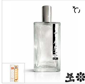
Inspirado en Hugo Boss Orange