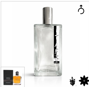
Inspirado en Emporio Armani Stronger With You