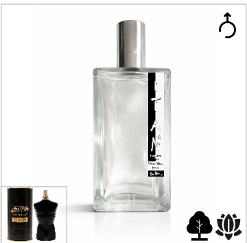
Inspirado en Jean Paul Gaultier Le Male