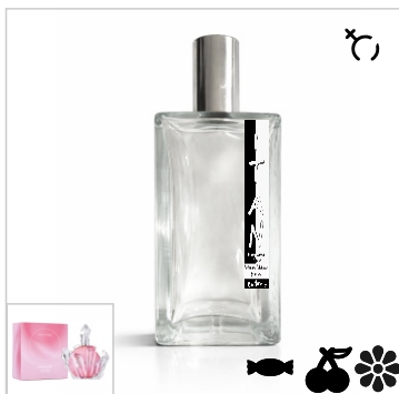
Inspirado en Ariana Grande R.E.M. Cherry Eclipse