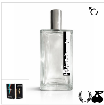
Inspirado en Animale