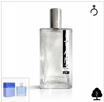
Inspirado en Nautica Voyage