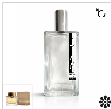
Inspirado en Burberry My Burberry