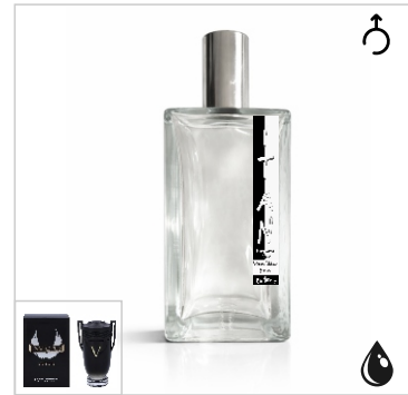
Inspirado en Paco Rabanne Invictus Victory