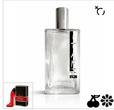
Inspirado en Carolina Herrera Very Good Girl