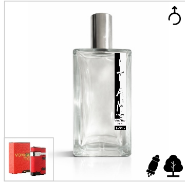
Inspirado en Armaf Voyage Titan