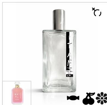
Inspirado en Kayali Vanilla Candy Rock Sugar 42