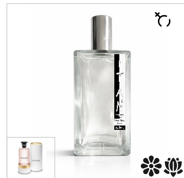
Inspirado en Louis Vuitton Attrape-Rêves