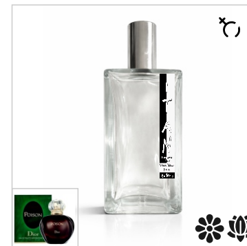
Inspirado en Christian Dior Poison