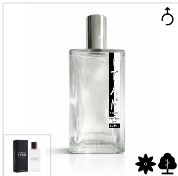
Inspirado en Abercrombie & Fitch Fierce