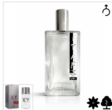
Inspirado en Hugo Boss Hugo XY