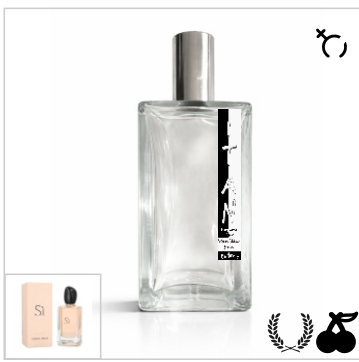
Inspirado en Giorgio Armani Sì