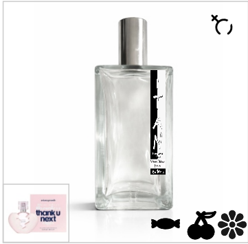
Inspirado en Ariana Grande Thank U Next