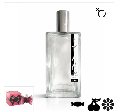
Inspirado en Victor & Rolf Bon Bon