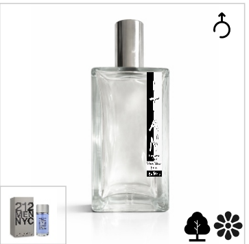
Inspirado en Carolina Herrera 212