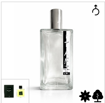
Inspirado en Guerlain Vetiver