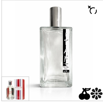
Inspirado en Tommy Hilfiger Tommy Girl