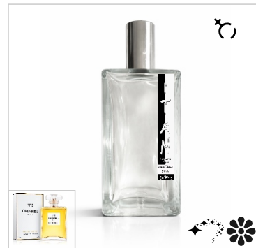
Inspirado en Chanel No. 5