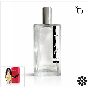
Inspirado en Paloma Picasso