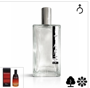
Inspirado en Christian Dior Fahrenheit