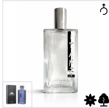
Inspirado en Dolce Gabbana K