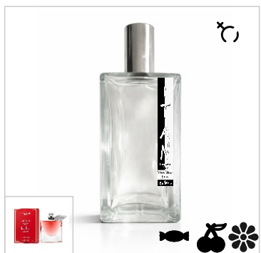
Inspirado en Lancome La Vie Est Belle L'Elixir