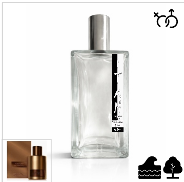
Inspirado en Tom Ford Oud Minérale