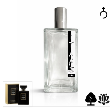
Inspirado en Chanel Coco Noir