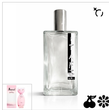
Inspirado en Katy Perry Meow