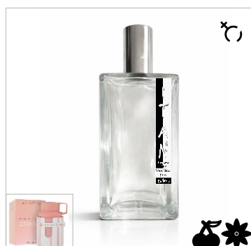
Inspirado en Armaf Odyssey Candee