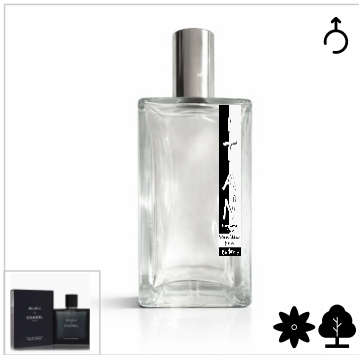
Inspirado en Chanel Bleu