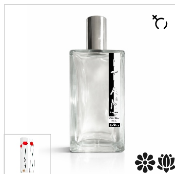
Inspirado en Kenzo Flower