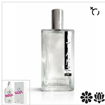
Inspirado en Calvin Klein Ck One Shock