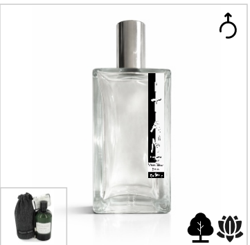
Inspirado en Geoffrey Beene Grey Flannel