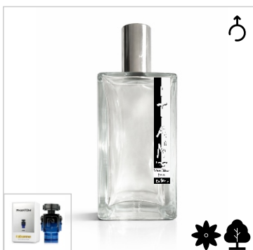
Inspirado en Paco Rabanne Phantom intense