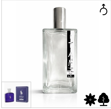
Inspirado en Ralph Lauren Blue