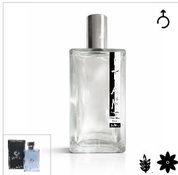
Inspirado en Versace Pour Homme