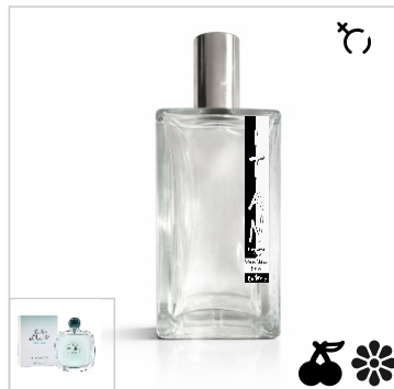
Inspirado en Giorgio Armani Acqua Di Gio