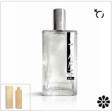
Inspirado en Perry Ellis 81 Sensual