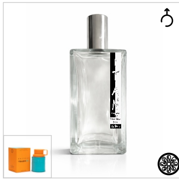
Inspirado en Armaf Odyssey Mandarin