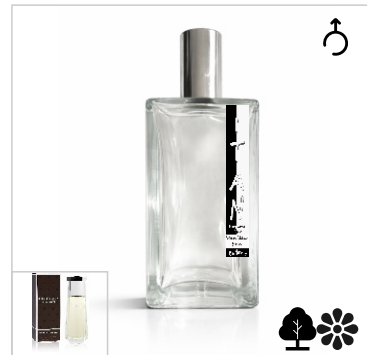
Inspirado en Carolina Herrera