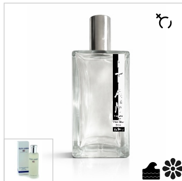
Inspirado en Ralph Lauren Polo Sport