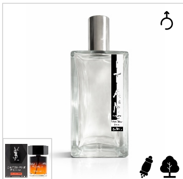
Inspirado en Yves Saint Laurent La Nuit De L'homme