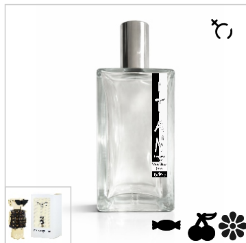
Inspirado en Paco Rabanne Fame