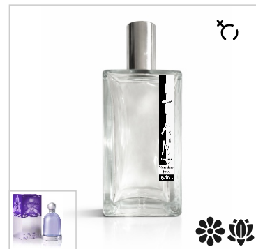
Inspirado en Jesus del Pozo Halloween