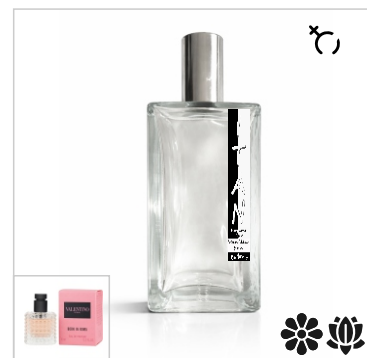
Inspirado en Valentino Donna Born In Roma