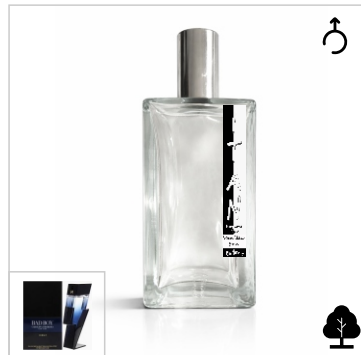
Inspirado en Carolina Herrera Bad Boy Cobalt