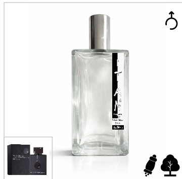
Inspirado en Armaf Club De Nuit Intense