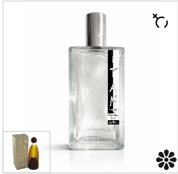
Inspirado en Benetton Tribu