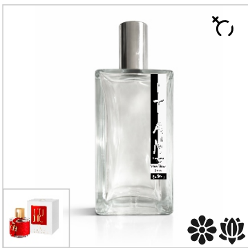
Inspirado en Carolina Herrera CH