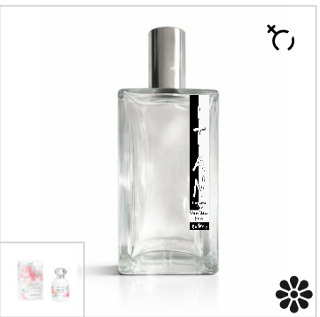
Inspirado en Cacharel Anais Anais