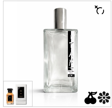
Inspirado en Guerlain Peche Mirage