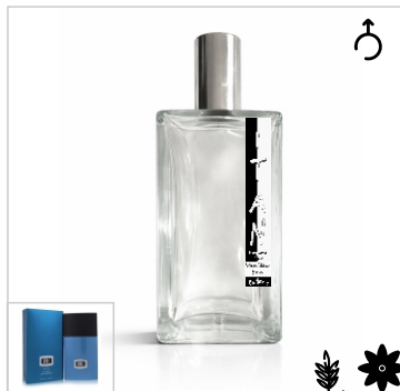
Inspirado en Perry Ellis Portfolio Elite