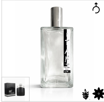
Inspirado en Mont Blanc Legend