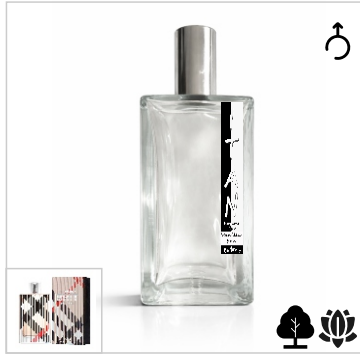
Inspirado en Burberry Brit