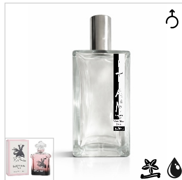
Inspirado en Guerlain La Petite Robe Noire