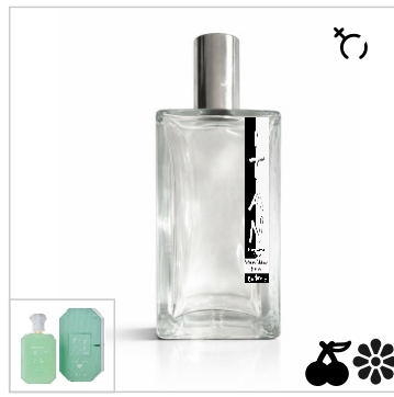
Inspirado en Kayali Pistachio Gelato 33