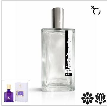
Inspirado en Creed Queen Of Silk