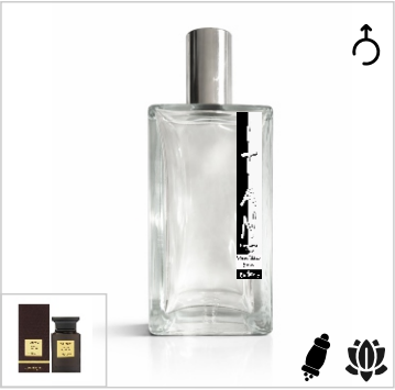
Inspirado en Tom Ford Tobacco Vanille