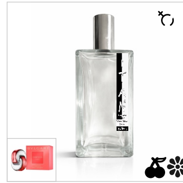
Inspirado en Bvlgari Omnia Coral