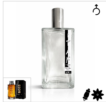
Inspirado en Hugo Boss The Scent