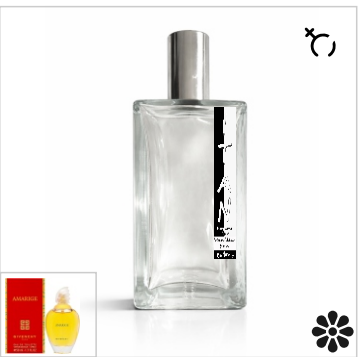
Inspirado en Givenchy Amarige