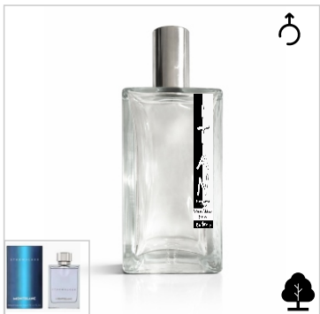
Inspirado en Montblanc Starwalker