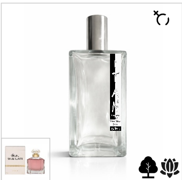
Inspirado en Guerlain Mon