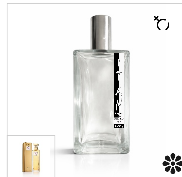
Inspirado en Elizabeth Arden 5th avenue