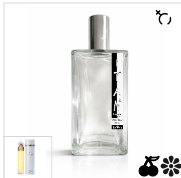
Inspirado en Perry Ellis 360