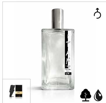
Inspirado en Carolina Herrera Bad Boy