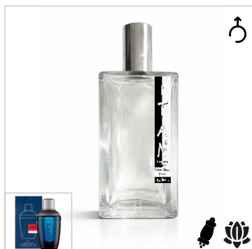
Inspirado en Hugo Boss Dark Blue