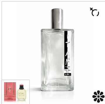
Inspirado en Yves Saint Laurent Paris