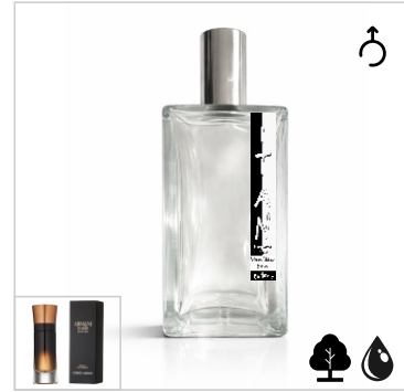
Inspirado en Giorgio Armani Code Profumo