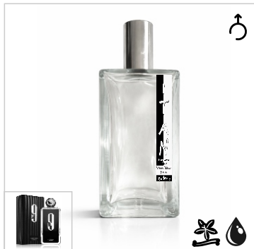
Inspirado en Afnan 9 Pm