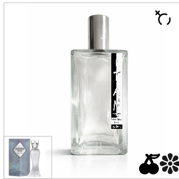
Inspirado en Paris Hilton Platinum