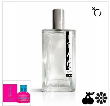
Inspirado en Ralph Lauren Ralph cool