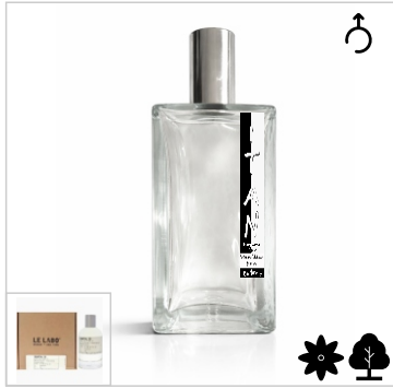
Inspirado en Le Labo Santal 33