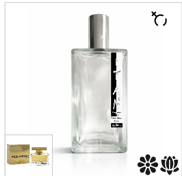
Inspirado en Dolce & Gabbana The One