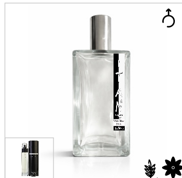
Inspirado en Perry Ellis Reserve