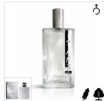
Inspirado en Chanel Allure Sport