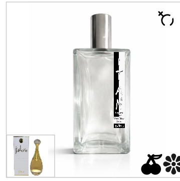
Inspirado en Christian Dior J'Adore