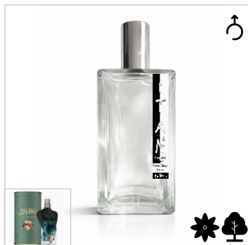
Inspirado en Jean Paul Gaultier Le Beau