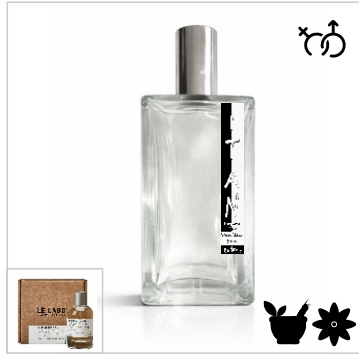
Inspirado en Le Labo The Matcha 26