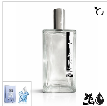
Inspirado en Thierry Mugler Angel