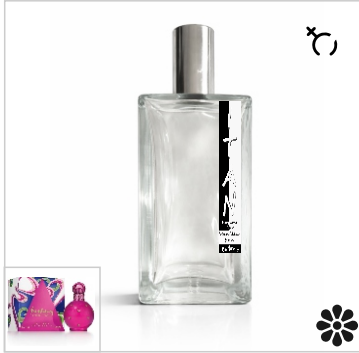
Inspirado en Britney Spears Fantasy