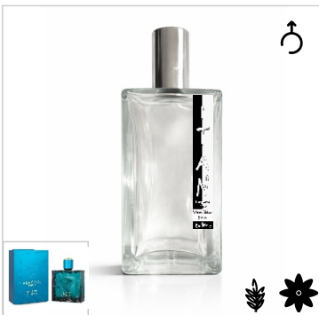
Inspirado en Versace Eros