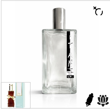
Inspirado en Estee Lauder Youth Dew