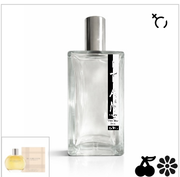
Inspirado en Burberry