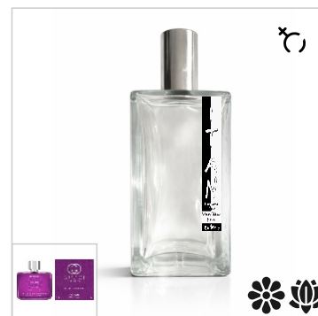
Inspirado en Gucci Guilty