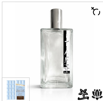
Inspirado en Sabrina Carpenter Sweet Tooth Me Espresso