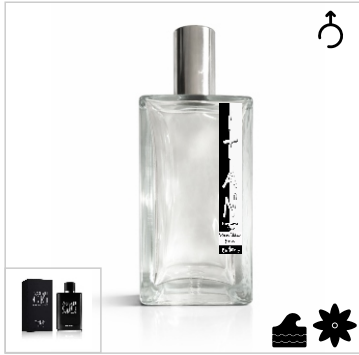
Inspirado en Giorgio Armani Acqua Di Gio Profumo