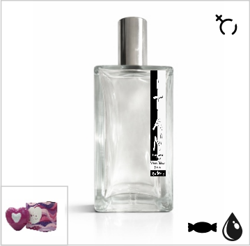
Inspirado en Escada Party Love