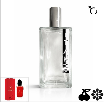
Inspirado en Giorgio Armani Si Passione