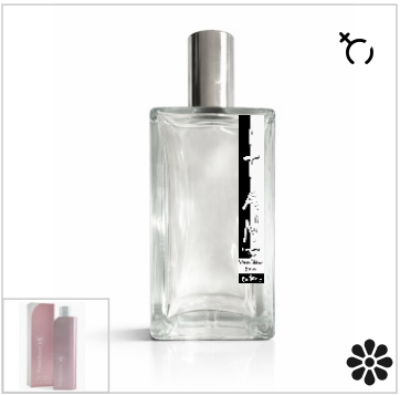
Inspirado en Perry Ellis 18