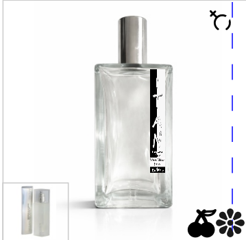
Inspirado en Donna Karan DKNY