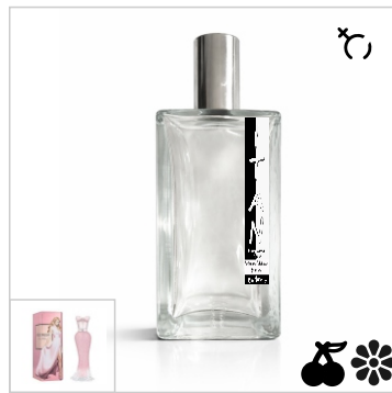
Inspirado en Paris Hilton Rose Rush