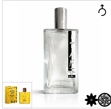
Inspirado en Versace Eros Energy