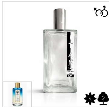
Inspirado en Mancera Cinque Terre