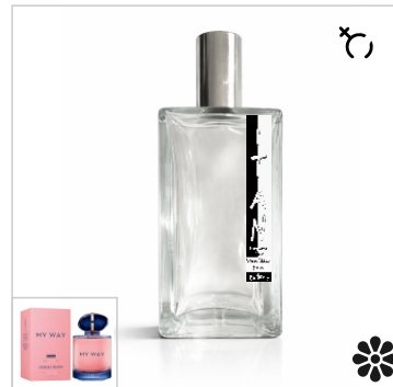
Inspirado en Giorgio Armani My Way