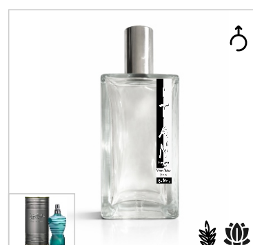
Inspirado en Jean Paul Gaultier Le Male