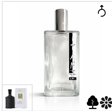
Inspirado en Creed Green Irish Tweed