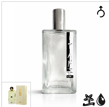
Inspirado en Afnan 9 Am