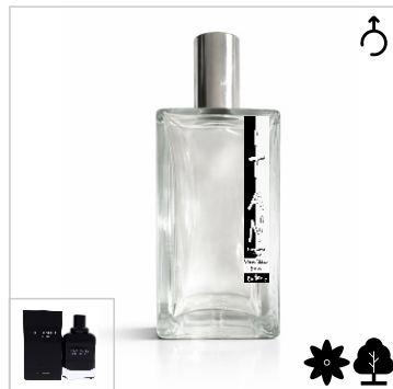
Inspirado en Givenchy Gentleman