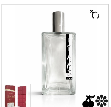
Inspirado en Sabrina Carpenter Sweet Tooth Cherry Baby