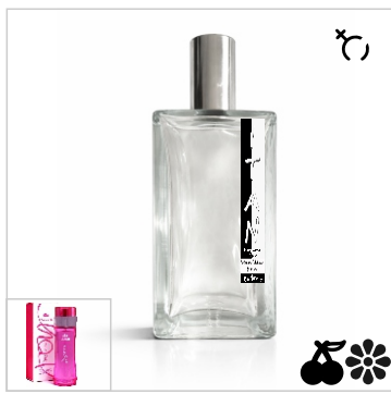
Inspirado en Lacoste Joy Of Pink