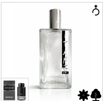
Inspirado en Montblanc Explorer