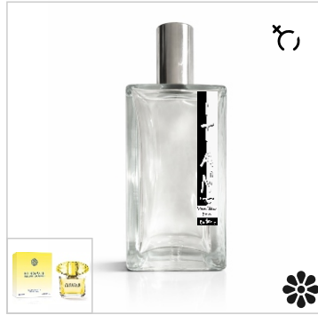
Inspirado en Versace Yellow Diamond