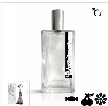
Inspirado en Selena Gomez