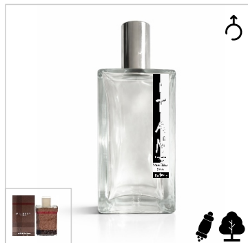
Inspirado en Blugos Orange