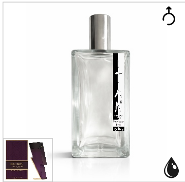
Inspirado en Carolina Herrera Bad Boy Dazzling Garden