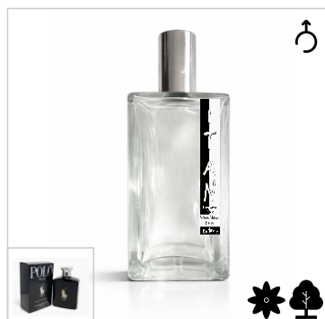
Inspirado en Ralph Lauren Black