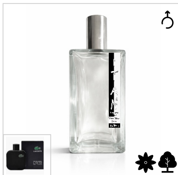
Inspirado en Lacoste Noir