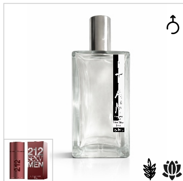
Inspirado en Carolina Herrera 212 Sexy Men