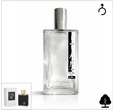
Inspirado en Carolina Herrera CH