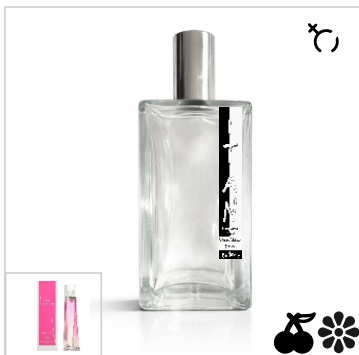
Inspirado en Givenchy Very Irrésistible