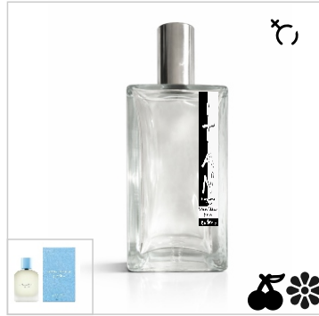
Inspirado en Dolce & Gabbana Light Blue