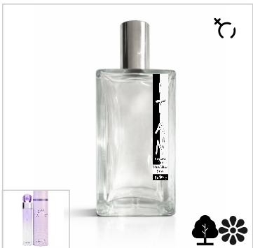
Inspirado en Perry Ellis 360 Purple