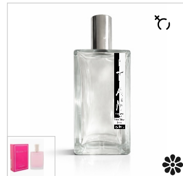
Inspirado en Lancome Miracle