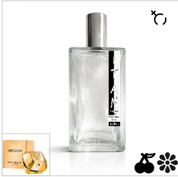
Inspirado en Paco Rabanne Lady Million