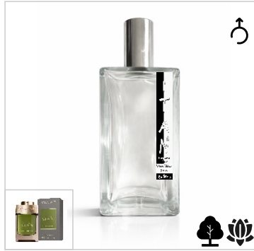
Inspirado en Bvlgari Man