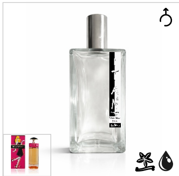
Inspirado en Prada Candy