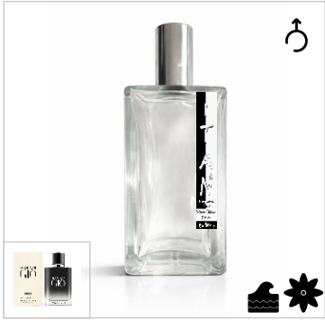
Inspirado en Giorgio Armani Acqua di Giò