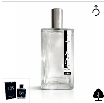
Inspirado en Giorgio Armani Acqua di Gio Elixir