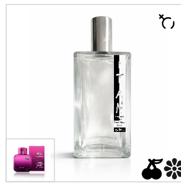
Inspirado en Lacoste L.12.12