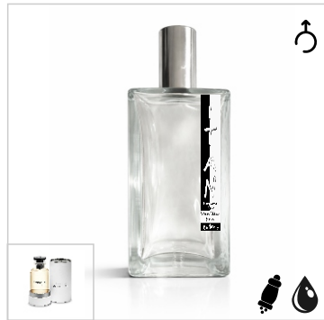
Inspirado en Louis Vuitton L'Immensité -