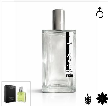
Inspirado en Calvin Klein Eternity