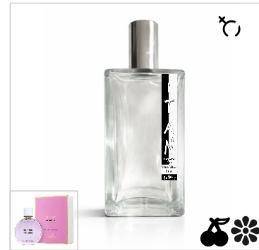
Inspirado en Chanel Chance Splendide