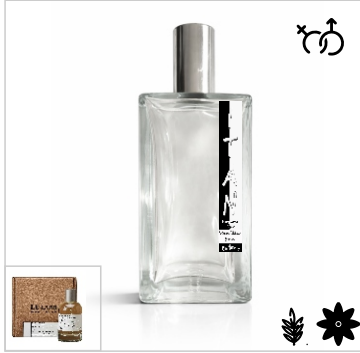
Inspirado en Le Labo Lavande 31