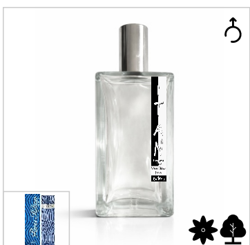
Inspirado en Paris Hilton Man