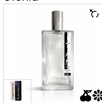
Inspirado en Paris Hilton Heiress