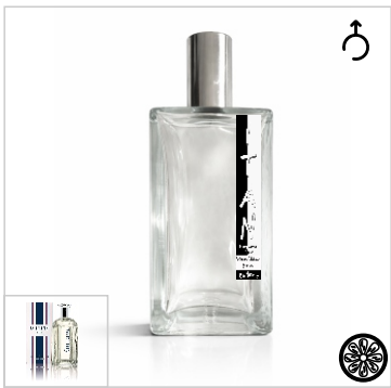
Inspirado en Tommy Hilfiger Tommy