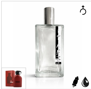
Inspirado en Hugo Boss Red