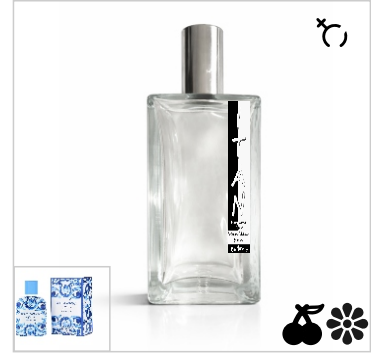
Inspirado en Dolce & Gabbana Light Blue Capri in Love