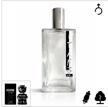
Inspirado en Moschino Toy Boy