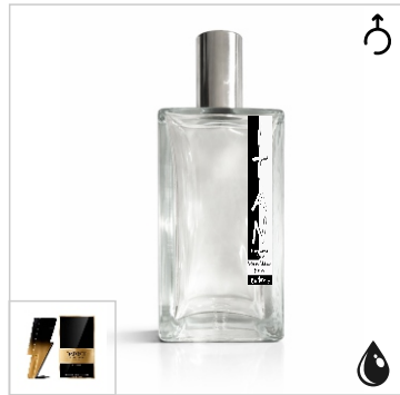
Inspirado en Carolina Herrera Bad Boy Extreme