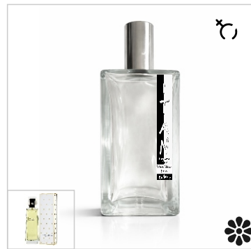
Inspirado en Carolina Herrera Eros