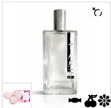
Inspirado en Ariana Grande Sweet Like Candy,