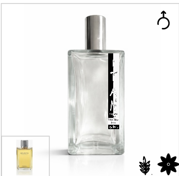
Inspirado en Yanbal Selecto