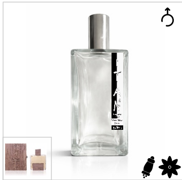
Inspirado en Solo Loewe Cedro