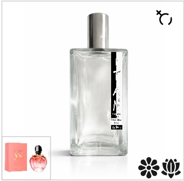
Inspirado en Paco Rabanne Pure XS