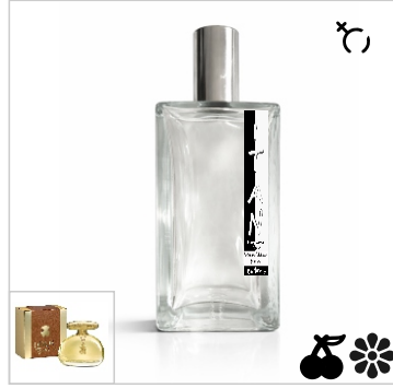
Inspirado en Tous Touch