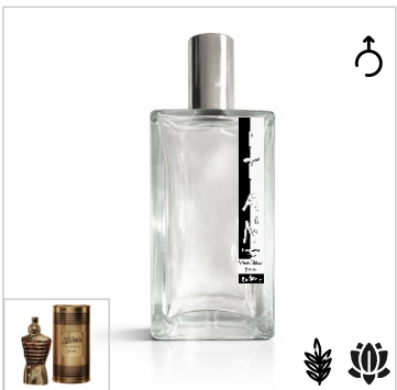
Inspirado en Jean Paul Gaultier Le Male Elixir