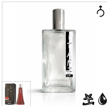
Inspirado en Hugo Boss Hugo Deep Red