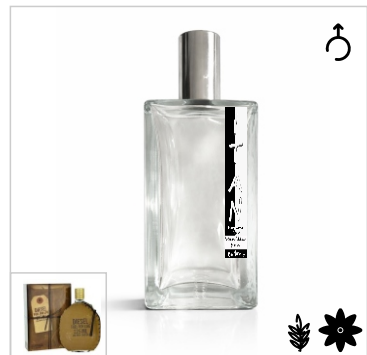
Inspirado en Diesel Fuel For Life