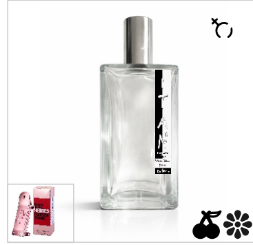
Inspirado en Carolina Herrera 212 Heroes