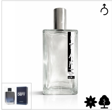
Inspirado en Calvin Klein Defy