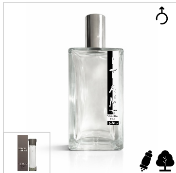
Inspirado en Giorgio Armani Mania