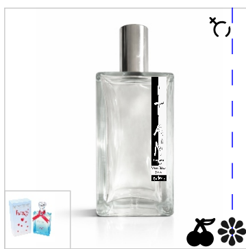
Inspirado en Moschino Funny