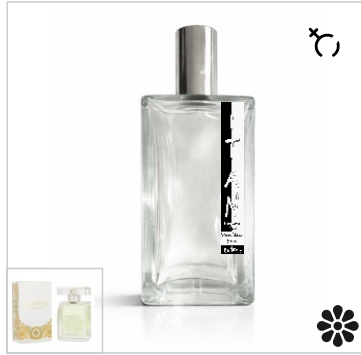
Inspirado en Versace Vanitas