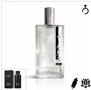
Inspirado en Giorgio Armani Code