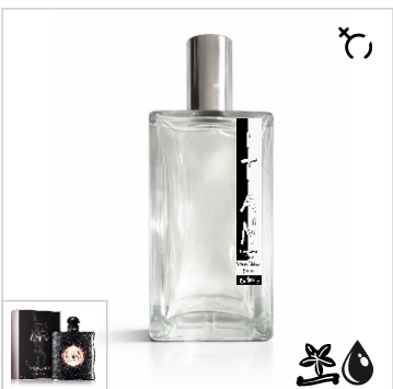
Inspirado en Yves Saint Laurent Black Opium