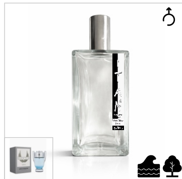
Inspirado en Paco Rabanne Invictus Aqua