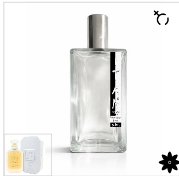
Inspirado en Huda Kayali Silk Santal 36