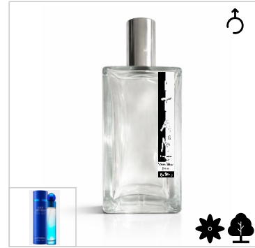
Inspirado en Perry Ellis 360 Very Blue