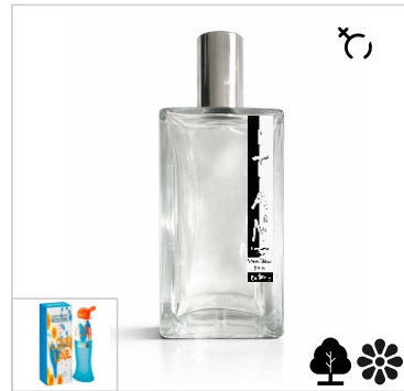
Inspirado en Moschino I love love