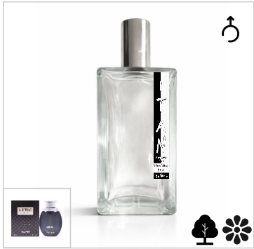
Inspirado en Swiss Arabian Imperial