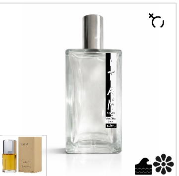
Inspirado en Calvin Klein Escape