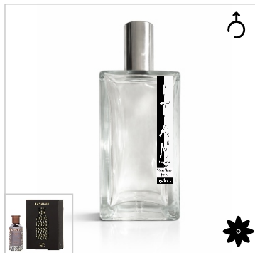
Inspirado en Bharara King