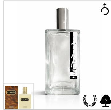
Inspirado en Aramis