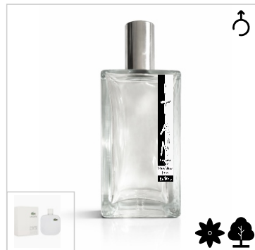
Inspirado en Lacoste Blanc