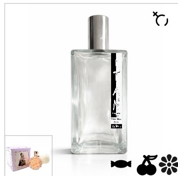
Inspirado en Ariana Grande Ari