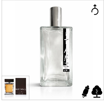
Inspirado en Dolce & Gabbana The One