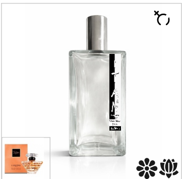
Inspirado en Lancome Tresor