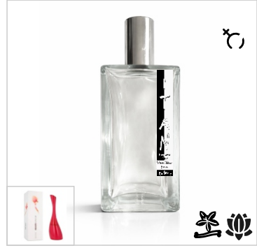
Inspirado en Kenzo Amour