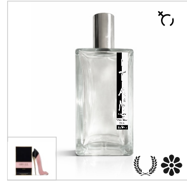
Inspirado en Carolina Herrera Good Girl Blush